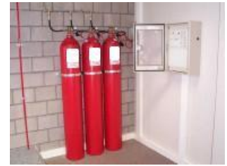
Bouteilles 300 bars